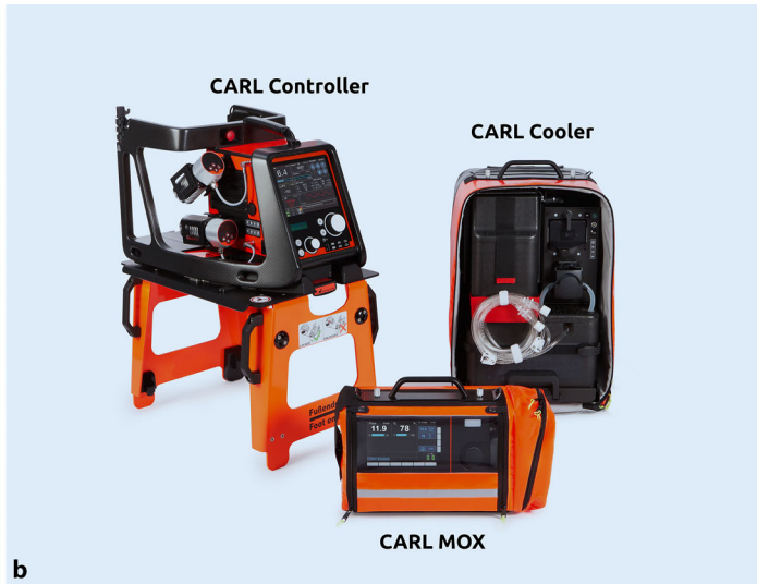
Abb. 2 ◀ a CIRD 1.0, b CARL-System.